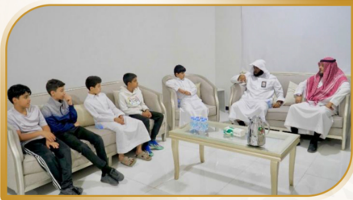
زيارة بعض طلاب المدارس